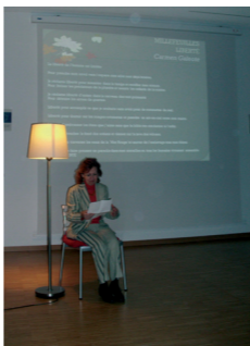
Lectura de poesía

Las Soirées tienen lugar en espacios varios los primeros martes de cada mes. Para conocer las localizaciones consultar www.mda.lu