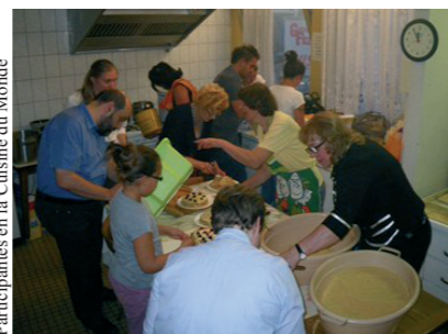
Participantes en la Cuisine du Monde

La Cuisine du Monde es una de las actividades en el marco del proyecto Festivasion www.festivasion.lu que promueve las relaciones interculturales e intergeneracionales.