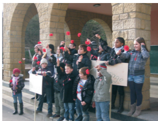
Imagen de la conmemoración de 2010

Los organizadores son: ABI-L (Amis des Brigades Internationales-Luxembourg), AREL (Amigos de la República española en Luxemburgo) e IU-PCE (Izquierda Unida-Partido Comunista de España). Colaboran estrechamente: centro de Documentación sobre Migraciones Humanas y Ville de Dudelange. Contacto: amisbiluxembourg@hotmail.com