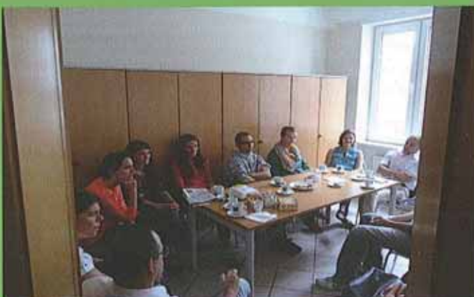
Reunión entre miembros de distintas asociaciones en la nueva sede.

El nuevo local de la FAEL recibe el nombre de Centro Español Lucien Wercollier, escultor cuya obra se expone con carácter permanente en el claustro de la abadía de Neumünster (CCRN: Centre Culturel de Rencontre Abbaye de Neumünster). Lucien se negó a colaborar con el nazismo y participó en la huelga nacional de 1942 contra los ocupantes. Detenido, internado y deportado, donó su obra "No pasarán", instalada en la estación Gare-Usines de Dudelange, a la asociación ABIL, Amis des Brigades Internationales à Luxembourg.