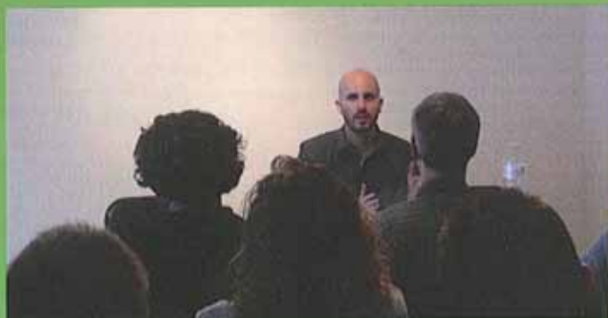
Charla celebrada en una de las salas del Centro Español Lucien Wercollier.

Este nuevo emplazamiento es una gran noticia para las diferentes asociaciones que componen la FAEL. Si en el pasado se utilizó el local del Centro Cultural Real Madrid en Esch-Sur-Alzette para la realización de la mayoría de actividades, como ya citamos antes, ahora éste ha sido sustituido por las nuevas oficinas en Luxemburgo.