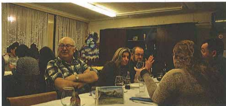
Noche de Cuisine du Monde en el antiguo local del Centro Cultural Real Madrid.

El local de la calle 60, Bld. Prince Henri nos deja con un sabor agridulce al recordar con nostalgia los buenos momentos que nos ha regalado. Pero la inauguración de los nuevos locales de la FAEL nos ofrece una nueva oportunidad de seguir creando historia en este hermoso país.