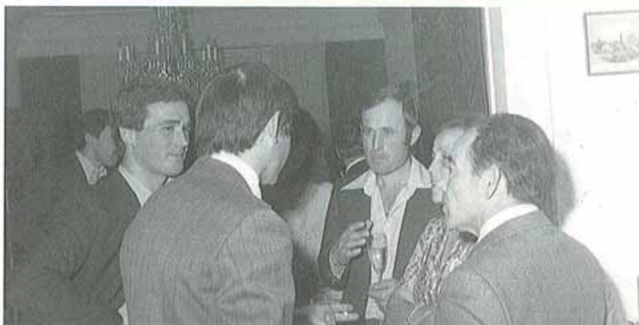
Miembros del mundo asociativo español reunidos por la visita de Adolfo Suárez a Luxemburgo.

La convicción por parte de las asociaciones de emigrantes reunidos de que sólo la emigración española organizada era capaz de defender eficazmente sus intereses fue el germen de todo el proceso que condujo en el año 1982