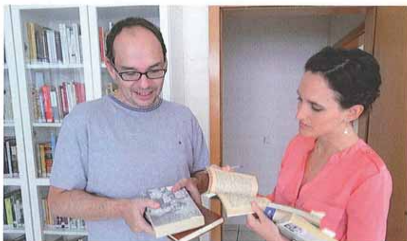
Dos voluntarios clasificando libros para la puesta a punto de la biblioteca del Machado.